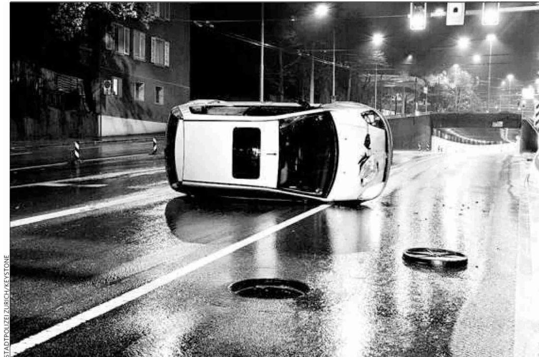
Le risque d'accident des jeunes conducteurs est deux à trois fois plus élevé que pour les plus âgés.

Themen-Nr.: 271.008 Abo-Nr.: 1069212 Seite: 15 Fläche: 38'421 mm 2